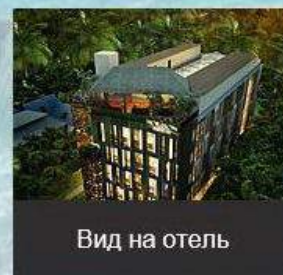
Вид на отель